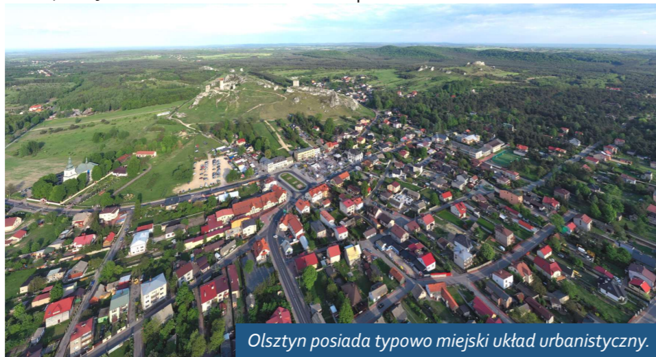
Olsztyn posiada typowo miejski układ urbanistyczny.

Historia parafii Olsztyn to historia miasta Olsztyn. Jestem dumny, że inicjatywa przywrócenia praw miejskich, zabranych Olsztynowi za karę przez cara po powstaniu styczniowym, nabiera realnych kształtów. Najmniejsze miasto w Polsce liczy nieco ponad 300 mieszkańców. Co rok liczne wsie w Polsce mają nadawane prawa miejskie, a Olsztyn ze swoją historią był przecież miastem. Przywrócenie praw miejskich to obowiązek i zadośćuczynienie sprawiedliwości historycznej.